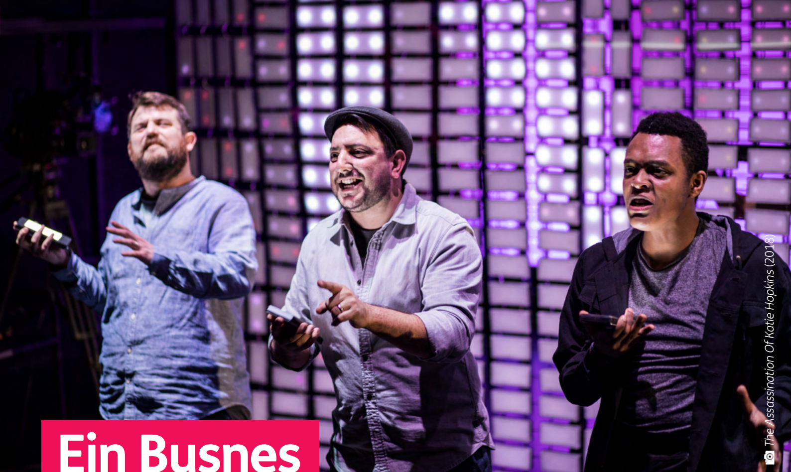
The Assassination Of Katie Hopkins (2018)