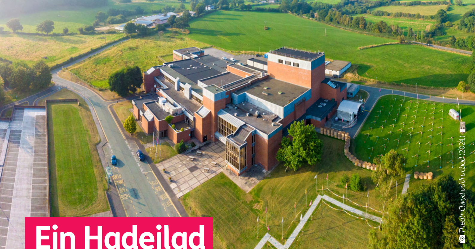
Theatr Clwyd oddi uchod (2024)