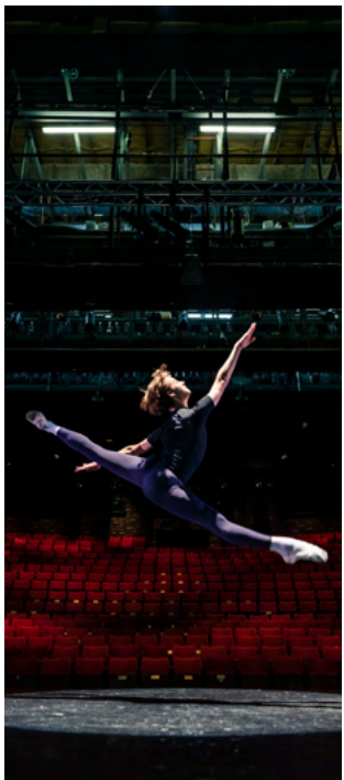
Prif Dŷ (2019)

Bydd gofod penodol ar gyfer hyfforddiant mewn creu theatr, ein gwaith gyda phobl ifanc, ein partneriaethau atgyfeirio ar gyfer iechyd a lles, a gofod ar gyfer digwyddiadau ac arlwyo i helpu i gynyddu'r referniw sy'n cael ei gynhyrchu.