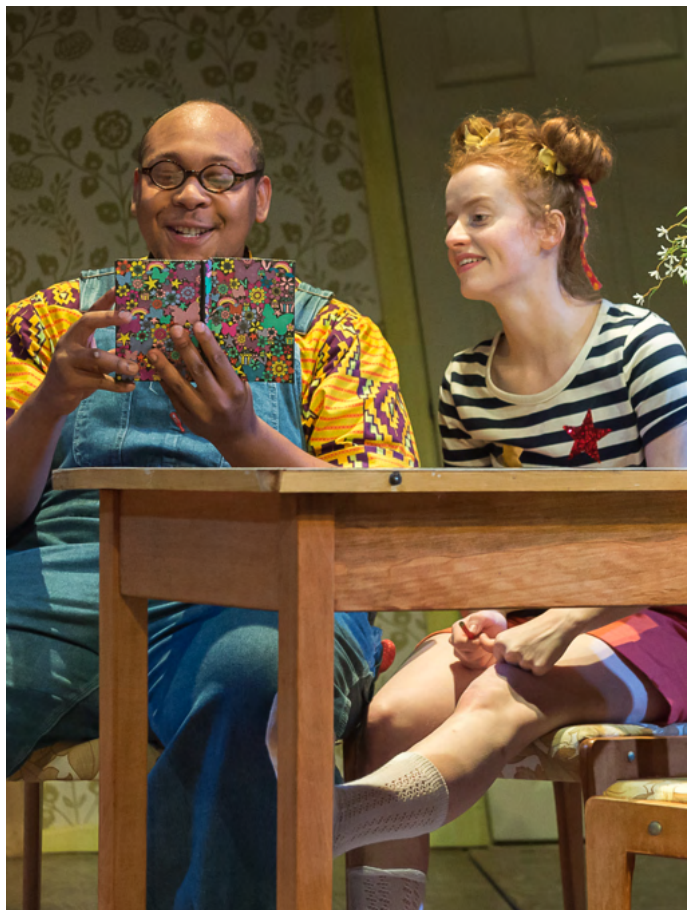
To Dream Again (2016)

Ni yw un o'r ychydig theatrau yn y DU sydd â thimau adeiladu golygfeydd, creu gwisgoedd, props a chelf golygfaol o hyd i gyd yn fewnol ochr yn ochr â'r timau goleuo, sain a llwyfan. Rydyn ni bob amser yn anelu at gynig yr amgylchedd cynhesaf i dimau creadigol gynhyrchu eu gwaith gorau.