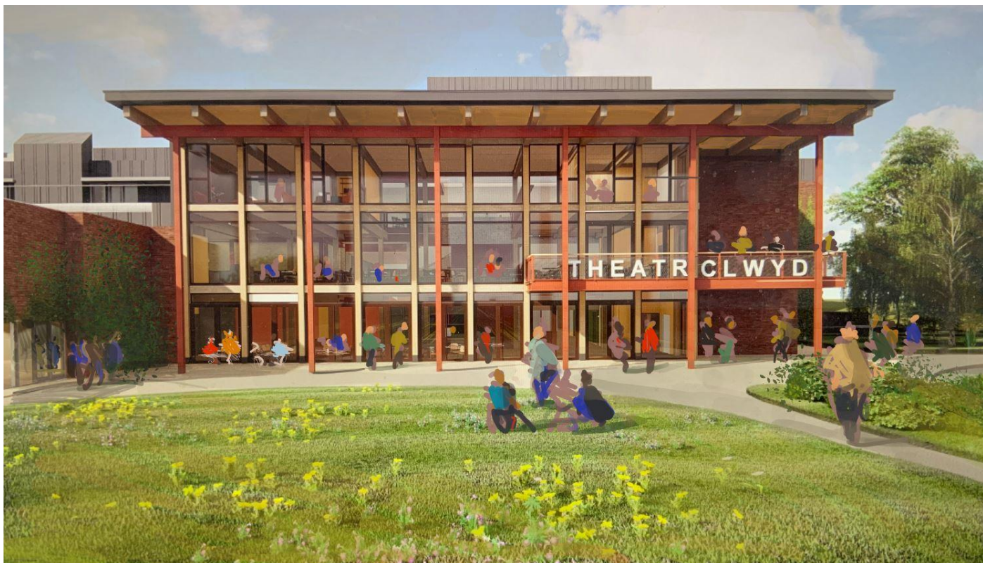
Delwedd o flaen yr adeilad wedi'i ailddatblygu

Mae'r strategaeth gelf gyhoeddus yn rhagweld Theatr Clwyd fel llwyfan ar gyfer syniadau presennol a newydd, gan ystyried celf gyhoeddus yn yr ystyr ehangaf; gofod ar gyfer gweithiau celf safle-benodol nodedig, sy'n adlewyrchu cymeriad, treftadaeth, cymuned a phensaernïaeth y theatr. Mae'r rhaglen arfaethedig yn cynnwys cyfnodau preswyl, digwyddiadau, a gweithiau celf parhaol, yn ogystal â chyfryngau digidol, cerflunwaith, pensaernïaeth a dylunio gofod cyhoeddus.