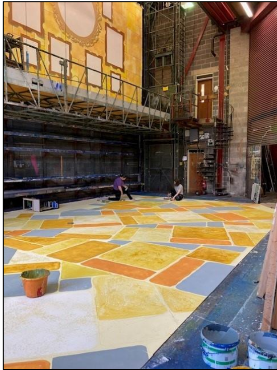
Ffotograffau o'r ffrâm paent